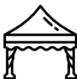
Namiot plenerowy 150m 2