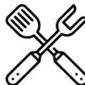
Sprzęt do grillowania