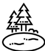
Ogród oraz staw z rybami