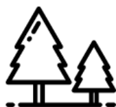
Ogromne tereny zielone