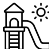
Ogrodzony plac zabaw dla dzieci

Jeśli mają Państwo pytania, chcą dokonać rezerwacji lub otrzymać wstępną ofertę, zapraszamy do kontaktu: